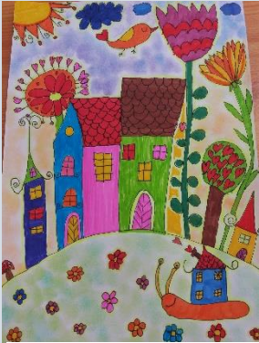
Szilágyi Léna, óvodás, Szivárvány óvoda - Debrecen